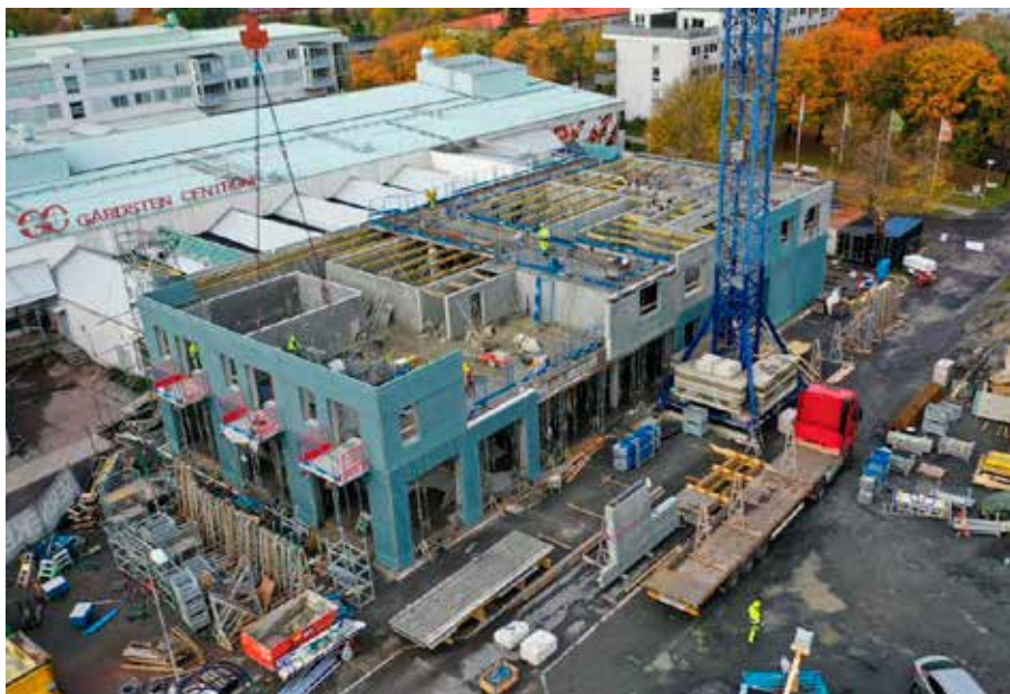
Pågående byggnation i Gårdsten Centrum