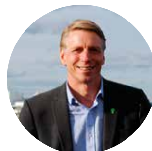
Bostads- och finansmarknadsminister Per Bolund (MP).

Gårdstensbladet tidigare berättat om i ett reportage. 📰