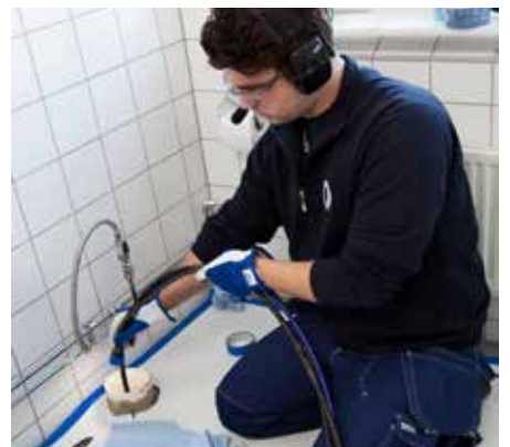
Gårdstensbostäder använder metoden relining – att bygga nya rör i de gamla i stället för stamrenovering.

Att tillämpa varsam renovering inom en rad olika områden är inget nytt för Gårdstensbostäder. Det är en långsiktig metod som använts sedan bolaget bildades och det är både ekonomiskt och ekologisk bra för att spara på jordens resurser. 🌱