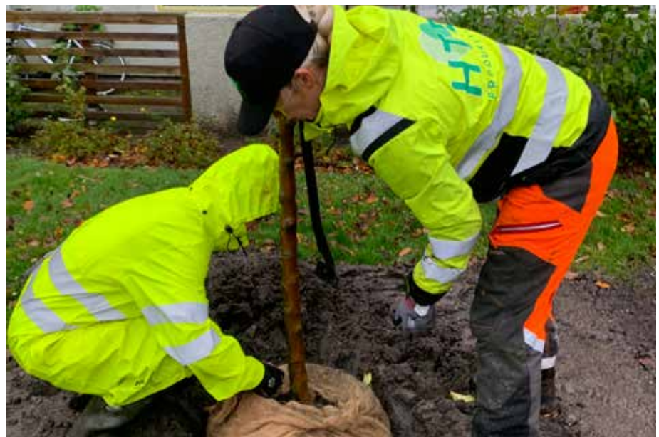
Nya träd planteras under hösten i västra Gårdsten

Träden i ett bostadsområde brukar ibland kallas för det gröna kapitalet. Gårdstensbostäders samlade trädbestånd på drygt 1 100 träd har ett totalt