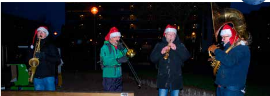
Provincialorkestern spelade härlig musik på Kastanjgården för seniorerna på Akaciagården 11 och 18.

Gårdstensbostäder önskar God Jul och Gott Nytt År!