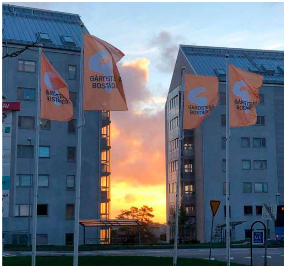
Under veckan 22-26/11 blir det orange flaggor på våra flaggstänger för att uppmärksamma Orange Day.

Den 25 november är det Orange Day – ett initiativ som ursprungligen tagits fram av FN för att uppmärksamma en värld fri från våld mot kvinnor och flickor. Färgen orange används för att det är en ljus och optimistisk färg. Kända byggnader i Göteborg kommer lysa orange och Gårdstensbostäder flaggar orange. Klä dig gärna i något orange för att uppmärksamma 25 november. Det gör vi. 🍷