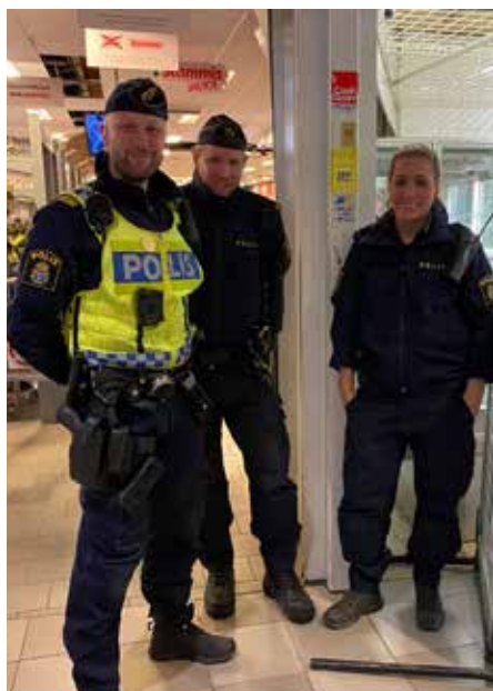
Polisen fanns också på plats för att fira med hyresgästerna.