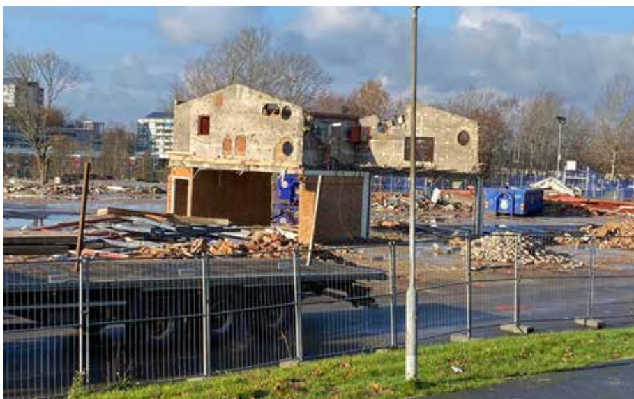
Det är inte mycket kvar av den gamla skolbyggnaden. Rivningen av Gårdstensskolan ska vara klar i januari 2022.

Under 2022 kommer lokalförvaltningen att projektera och genomföra upphandlingen för den nya skolan. Därefter kommer byggnationen att påbörjas under 2023.